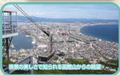
夜景の美しさで知られる函館山からの眺望