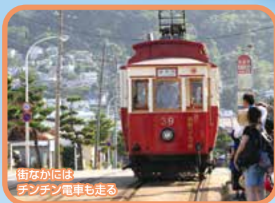
街なかには チンチン電車も走る