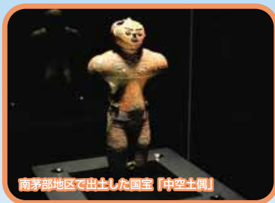
南茅部地区で出土した国宝「中空土偶」