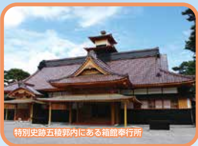
特別史跡五稜郭内にある箱館奉行所