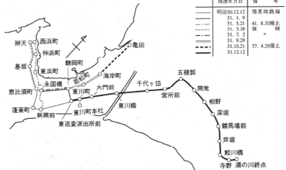
函館馬車鉄道路線図