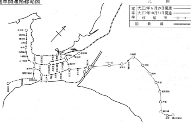
電車開通路線略図