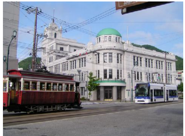
箱館ハイカラ號とらっくる号