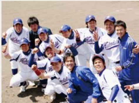
▶ 優勝後の記念撮影 (後列右から2人目)

勉学もさることながらそのほとんどは野球中心の生活を送っていました。3年生まではなかなか試合に勝てずつらい時期が続きましたが、4年生の春に優勝し全国大会へ出場することができました。優勝した時の野球部全員で大泣きして喜びを分かち合った感動は今でも忘れられない思い出です。