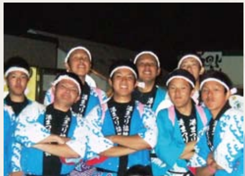
▶ 函館野外劇・みこし担ぎ (前列中央)

僕は食べるのが好きなので安くて量が沢山食べられるラッキーピエロやなかみ食堂(チキンカツ定食や鳥から定食を良く食べてました。もちろんご飯は大盛りです!)には良く行きました。今でも函館に行ったときには食べに行っています。夏には野球部で参加した野外劇が思い出に残っています。函館の歴史を肌で感じて参加出来たことは思い出にもなりました。楽しい勉強になりました。