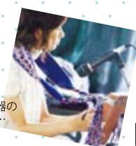
アフリカ民族楽器の 演奏にうっとり…