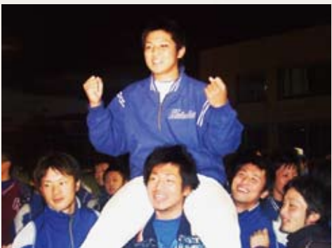
▶ ドラフト後の記念撮影

やはりレギュラーをとることが目標です。昨年は1軍で試合に出場してもらい経験を積ませていただいたので今年は勝負の年です！