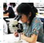
顕微鏡で模写 しています…