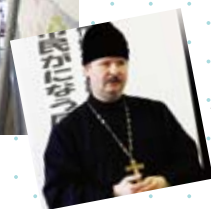
ハリストス正教会 神父さんによる講義