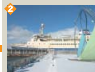
2 シーポートプラザ 青函連絡船・摩周丸が歴史を紹介するメモリアルシップとして保存されています。