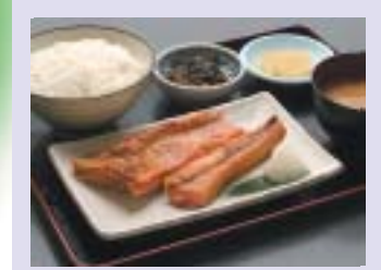
鮭 秋の収穫祭では主役となる鮭。この脂ののったハラスは、もう絶品！