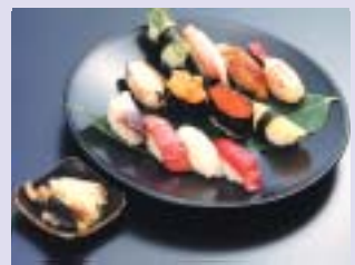
寿司 新鮮な魚介類が豊富な函館は、おいしい寿司屋さんがいっぱい。