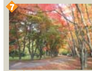
7 見晴公園(秋) 市民の憩いの場として古くから親しまれています。(カエデ並木の紅葉)