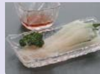
イカソーメン 細長く切ったイカを、生姜を入れたつゆにつけて食べる、これが函館流。