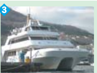
3 函館港内遊覧船 函館港を一周する遊覧船で、カフェクルーズやナイトクルーズを楽しめます。