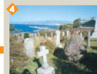
4 外国人墓地 小高い丘にロシア人墓地、プロテスタント墓地、中国人墓地があります。