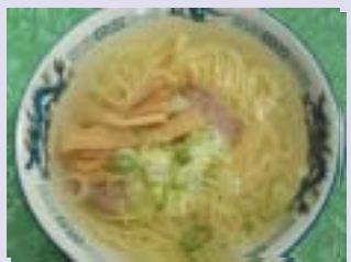
塩ラーメン 函館といえば塩ラーメンと言われてるけど、味噌しょう油も美味しい！