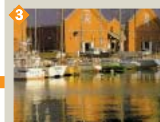
3 金森倉庫群 古い赤れんがの倉庫がレストランやショッピング街として賑わっています。