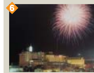
6 花火大会(夏) 函館では毎年夏に、大きな花火大会が3回もあります。いずれも盛大！