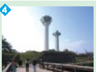
4 五稜郭タワー(展望台エレベーター) 新しくなった五稜郭タワーはその高さ107m。函館山や市内を一望できます。