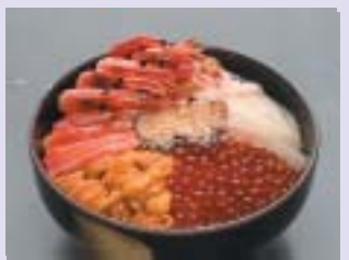
海鮮丼 ご飯の上ののったネタも半端な量ではない。豪快な味を堪能しちゃおう！