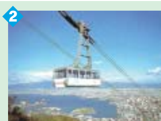
2 函館山ロープウェイ 125人乗りの大きなロープウェイは山頂まで約3分で到着。