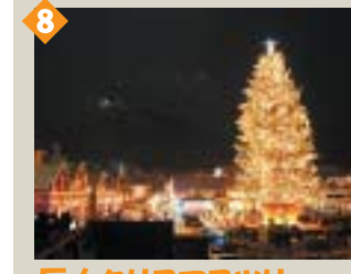
8 巨大クリスマスツリー(12月) 毎年カナダから届く大きなツリーが函館の冬の名物になりました。