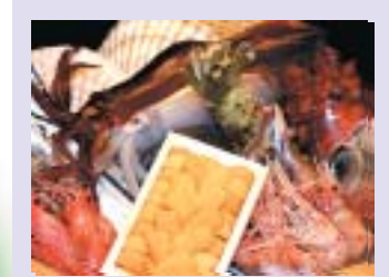
とにかく新鮮な海の幸 海に囲まれた「まち」ならではの豊富な新鮮素材を一年中楽しめます！