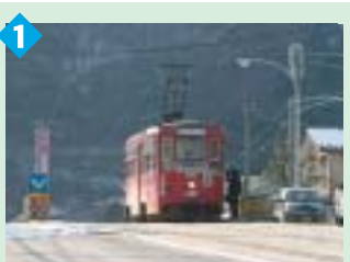
1 路面電車 日本で7番目に誕生した路面電車。一日乗車券で市内観光はいかが？