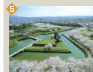
5 五稜郭公園の桜(春) 日本最初の本格的洋式城郭・五稜郭の桜は、毎年みごとに花を咲かせます。