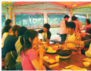
←各班ごとにプレゼンテーション ←大沼でジンギスカン 集中講義募集チラシ→