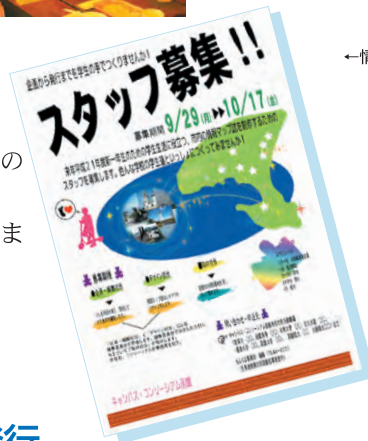
←情報マップ誌スタッフ募集チラシ ↓企画・編集会議の様子

これは教育大、未来大、函館大、函短の有志が集まって企画から発行まで学生で手掛けています。